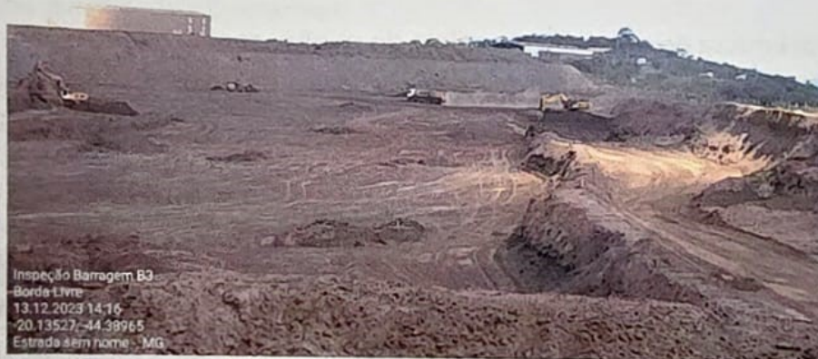
Escavação realizada por conjuntos escavadeiras e caminhões basculantes.

Esta tecnologia demanda, para sua implementação, a utilização de escavadeiras, caminhões, motoniveladoras, caminhões pipa, tratores de esteira. Para deslocamento do pessoal para operação, manutenção e inspeção, são utilizados veículos com tração 4x4.